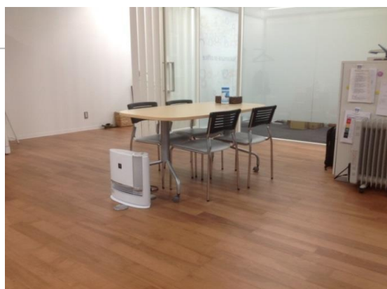
使用品番:D-3K300 ショコラ色

今月は大阪市内の事務所で使用した de niroを紹介します。 場所はテナントビルの10階。本来は土足が 通例の事務所に住宅用のde niroを採用した のには理由があります。それはやりがい を感じながら、仕事ができる環境作りに、 オーナー様の強い思いがあったからです。 「天然木床材の癒しの空間、自然の息吹を あなたのお部屋に」 来月号もよろしくお祈いします。